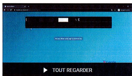
COMPAS - formation

https://www.youtube.com/playlist?list=PLPiKBmXABEci7RSuBTnIVihODUhneHfG7